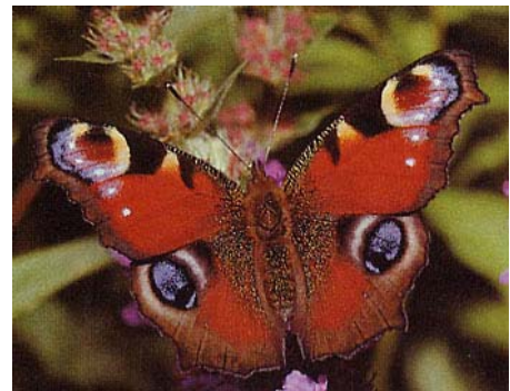
Paon de jour

En Europe, la plupart des papillons passent l'hiver à l'état de chrysalide ou de chenille, mais 13 espèces de papillons hibernent à l'état adulte : le Citron qui est souvent le premier papillon à voler au Printemps, se dissimule dans le lierre ou le houx. Ailes repliées, il est camouflé grâce à la couleur du dessous de ses ailes, gris-vert striées.